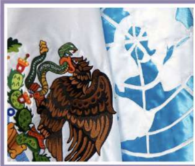
HISTÓRICO DE OBSERVACIONES FINALES DIRIGIDAS A MÉXICO