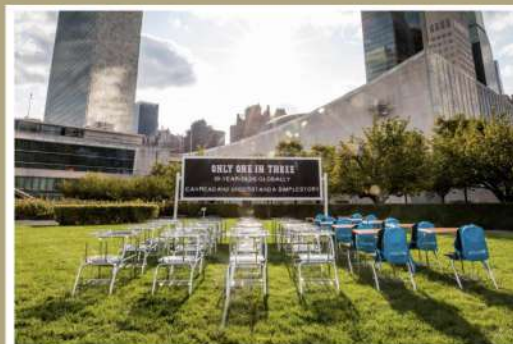
Imagen de la instalación al "Aula de la crisis del aprendizaje" de UNICEF en la sede de las Naciones Unidas en Nueva York, el 14 de septiembre de 2022.